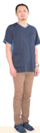
歯科口腔外科医長