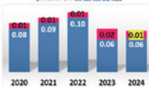
内訳：年度別 院内褥瘡発生率(%) (MDRPU+自重性褥瘡)

「MDRPU(医療関連機器圧迫損傷)発生率」をQM指標(Quality Management指標)に掲げて活動しました。2023年度に増加したMDRPUが、この活動により低下しました。この活動に対して職員表彰をしていただきました！