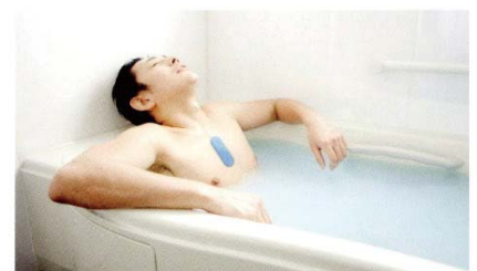
図1. コードレス型ホルター心電図

装着したままシャワーや半身浴が可能です。夏場に入浴できない不快感もありません。また、冬場はヒートショックの評価も可能となります。