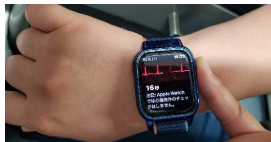
図2. スマートウォッチの心電計